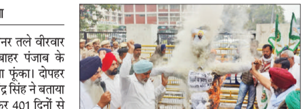
सिरसा। लघु सचिवालय में पंजाब के मुख्यमंत्री का पुतला फूँकते किसान।