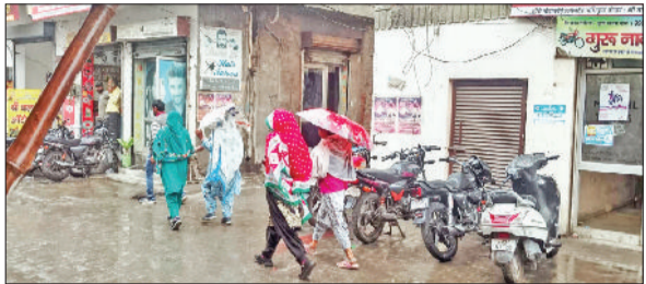
फतेहाबाद। भूना रोड पर गांव भाजरा के पास तेज हवाओं से बिछी गेहूं की फसल तथा दोपहर बाद शहर में हो रही बूदाबांदी।

गेहूं की बिजाई के बाद से ही इस बार अमी तक बारिश नहीं हुई। पहले तेज गर्मी व बढ़ते तापमान से गेहूं की फसल को खतरा बताया गया था। ऐसा 13 साल बाद हो रहा है कि दिसम्बर से लेकर फरवरी तक जिले में बारिश न हुई हो। ज्यादा ठंड से सरसों की फसल को नुकसान पहुंचा। अब तेज हवाएं व बूदाबांदी से गेहूं की फसल को नुकसान हो रहा है। गेहूं की फसल को अब अंतिम सिंचाई की जरूरत थी, तब किसानों के सिर पर ओले आन पड़े वाली स्थिति पैदा हो गई। किसानों को उर है कि हवाओं के बाद अगर ओलावृष्टि हुई तो गेहूं की काफी नुकसान हो सकता है। भविष्यवाणी की हुई है। वीरवार सुबह से ही तेज हवाएं चलने से तापमान में गिरावट आनी शुरू हो गई। वीरवार सुबह जहां हलकी बूदाबांदी हुई वहीं उसके बाद तेज हवाएं चलीं। ऐसे में पकने को तैयार गेहूं की फसल नीचे बिछ गई। यहां के गांव ढाणी भाजरा, बिसला, ढाणी रायपुर, भिरडाना, भूना के गांव टिब्बी, डूल्ह, लहरियां, सांचला, जाखल के सिधानी, साधनवास, जमालपुर व कुलां के