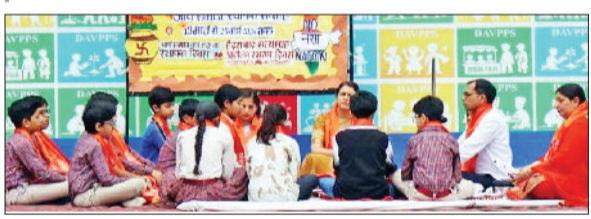
फतेहाबाद। आर्य समाज के स्थापना दिवस समारोह में भाग लेते विद्यार्थी।

फतेहाबाद। पुलिस लाइन स्थित डीएवी पुलिस पब्लिक स्कूल, फतेहाबाद में आर्य समाज के स्थापना सप्ताह के उपलक्ष्य में एक मध्य, आध्यात्मिक एवं प्रेरणादायक कार्यक्रम का आयोजन किया गया। कार्यक्रम का उद्देश्य विद्यार्थियों एवं समाज में वैदिक मूल्यों, नैतिक शिक्षा एवं सामाजिक जागरूकता का प्रसार करना रहा। कार्यक्रम का शुभारंभ प्रातःकाल यज्ञ एवं देव मंत्रों के उच्चारण के साथ हुआ। यज्ञ में प्रधानाचार्य, शिक्षकगण एवं विद्यार्थियों ने आहुति देकर विश्व शांति, समृद्धि एवं मानव कल्याण की कामना की। इस दौरान वातावरण पूर्णतः आध्यात्मिक ऊर्जा से ओत-प्रोत हो गया। कार्यक्रम में विद्यार्थियों द्वारा प्रस्तुत भाषणों में महान समाज सुधारक स्वामी दयानंद सरस्वती जी के जीवन, उनके विचारों एवं उनके द्वारा स्थापित आर्य समाज के उद्देश्यों पर प्रकाश डाला गया। वक्ताओं ने बताया कि स्वामी दयानंद सरस्वती जी ने 10 अप्रैल 1875 को आर्य समाज की स्थापना कर समाज में व्याप्त अंधविश्वास, कुुरीतियों एवं सामाजिक भेदभाव के विरुद्ध एक संशुद्ध आंदोलन का प्रारंभ किया गया। अंधविश्वास एवं अशिक्षा के दुष्प्रभावों को दूर्यति हुए शिक्षा, समानता एवं सत्य के मार्ग पर चलने का संदेश दिया गया।