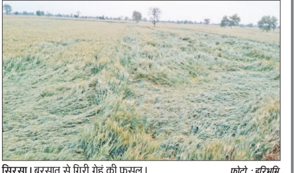
सिरसा। बरसात से गिरी गेहूं की फसल।