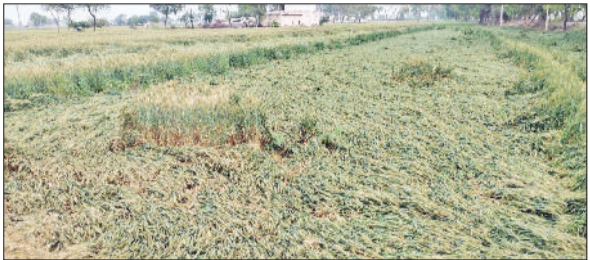
फतेहाबाद। भूना रोड पर गांव भाजरा के पास तेज हवाओं से बिछी गेहूं की फसल तथा दोपहर बाद शहर में हो रही बूदाबांदी।

प्रदेश में पश्चिमी विक्षोभ के प्रभाव के चलते वीरवार दिनभर बादलवाही के बाद तेज रफ्तार से हवाएं चली और उसके बाद हलकी बारिश होने लगी। दिनभर हुई बूदाबांदी से खेतों में पकने को तैयार गेहूं की फसल बिछ गई, जिससे किसानों की नींद उड़ने लगी है। ऐसे में अगर ज्यादा बरसात हुई तो गेहूं की फसल को खराब होने से कोई नहीं रोक सकता। मौसम बिगड़ने से यहां का अधिकतम तापमान 6 डिग्री गिरकर 21 डिग्री रह गया जबकि न्यूनतम तापमान 16 डिग्री सेल्सियस रह गया। बता दें कि एक सप्ताह पहले यहां तापमान 35 डिग्री तक पहुंच गया था वहीं न्यूनतम तापमान 19 डिग्री हो गया था। इसके बाद पश्चिमी विक्षोभ एक्टिव होने से तापमान में लगातार गिरावट आ रही है। 14 डिग्री तक तापमान गिरने से एक बार फिर ठंड वापस लौट आई है। पिछले दिनों हिसार स्थित चौधरी चरण सिंह हरियाणा कृषि विश्वविद्यालय के मौसम विभाग ने 21 मार्च तक पश्चिमी विक्षोभ के प्रभाव से मौसम बिगड़ने की