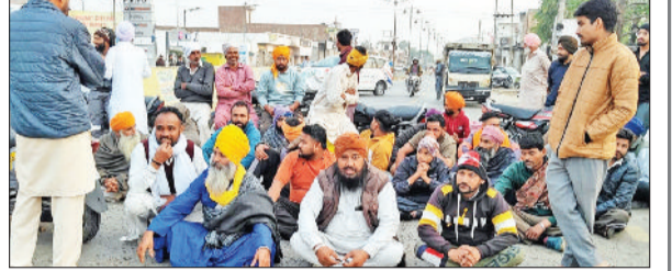
रतिया। गैस किल्लत को लेकर रोड जाम करते गैस उपभोक्ता।

समारोह और अन्य सामाजिक कार्यक्रम पहले से बुक हैं, लेकिन गैस सिलेंडरों की सीमित उपलब्धता के चलते व्यवस्थाएं प्रभावित हो रही हैं। इस समस्या को लेकर वे उपायुक्त से भी मिल चुके हैं लेकिन अभी तक उन्हें पर्याप्त मात्रा में कमर्शियल सिलेंडर नहीं मिल रहे हैं।