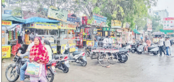
फतेहाबाद। पपीहा पार्क के सामने स्थित फास्ट फूड की दुकानें।

रेहड़ी संचालकों पर इसका सीधा असर पड़ा है। सिलेंडर की अनियमित आपूर्ति के चलते उन्हें खाद्य पदार्थों के दाम बढ़ाने और मेन्यू में कटौती करने को मजबूर होना पड़ रहा है। शहर के मांडल टाऊन स्थित पपीहा पार्क के सामने और हुडा सेक्टर 3 मार्किट में खड़े फास्ट फूड रेहड़ी संचालकों के अनुसार, जिन खाद्य पदार्थों में अधिक गैस की खपत होती थी, उन्हें फिलहाल बंद कर दिया है। पहले जहां रोजाना डोसा, चाउमीन, सोयाबीन चाप और अन्य आइटम बनाए जाते थे, अब कई रेहड़ियों पर ये पूरी तरह बंद हो चुके हैं। कुछ संचालक तो तभी बाजार में रेहड़ी लेकर आ रहे हैं जब उन्हें सिलेंडर मिल जाता है, अन्यथा उन्हें छुट्टी करनी पड़ रही है। हुडा सेक्टर 3 स्थित रेहड़ी संचालक